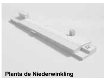
Planta de Niederwinkling