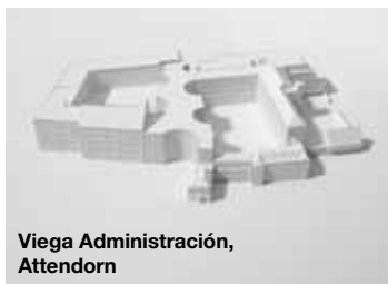
Viega Administración, Attendorn

El compromiso con la más alta calidad comienza ya en la selección de los materiales. En Viega se utilizan únicamente materiales que cumplen los requisitos más exigentes. Y esto se aplica tanto en el caso de los productos que van a estar en contacto con medios muy sensibles, como el agua potable, como en el de todos aquellos que van a estar expuestos a esfuerzos muy elevadas. En cinco localizaciones en Alemania como en cinco localizaciones internacionales, generan unos muy motivados trabajadores la calidad Viega.