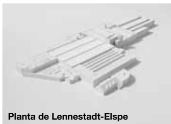
Planta de Lennestadt-Elspe

El compromiso con la más alta calidad comienza ya en la selección de los materiales. En Viega se utilizan únicamente materiales que cumplen los requisitos más exigentes. Y esto se aplica tanto en el caso de los productos que van a estar en contacto con medios muy sensibles, como el agua potable, como en el de todos aquellos que van a estar expuestos a esfuerzos muy elevadas. En cinco localizaciones en Alemania como en cinco localizaciones internacionales, generan unos muy motivados trabajadores la calidad Viega.