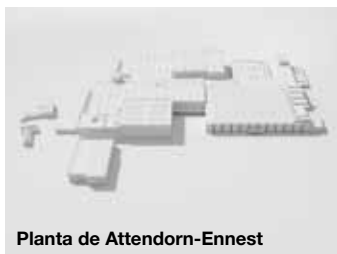
Planta de Attendorn-Ennest