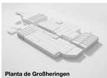
Planta de Großheringen